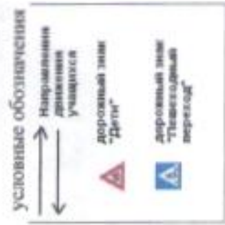
Схема бетонного маршрута в Первомайск Манский район, МБДОУ детский сад «Колобок»